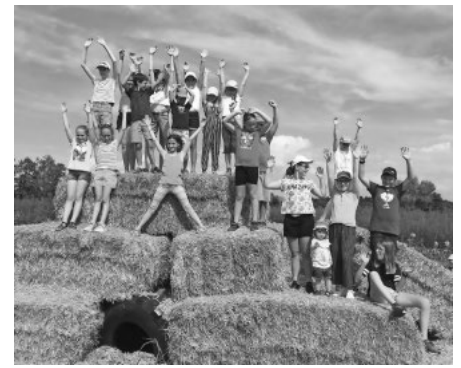
Wir hatten viel Spaß im Labyrinth.

Samstag, 10.09.22 Hochzeit Manu&Achim, 13:30 Uhr - 15:30 Uhr