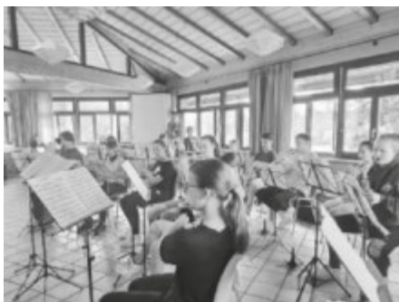
Die Juka beim Proben

Unsere JungmusikerInnen haben vom 03. bis zum 05. Juni in der Jugendherberge in Breisach fleißig geübt. Außer Musik machen standen noch weitere Dinge wie Grillen oder Spieleabende auf dem Programm. Die 15 TeilnehmerInnen hatten jede Menge Spaß und freuen sich schon auf das nächste Probewochenende.