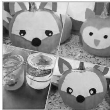
Die Ergebnisse unserer Bastelaktion

Freitag, 12.11.21, 18:30 Uhr St. Martinsumzug