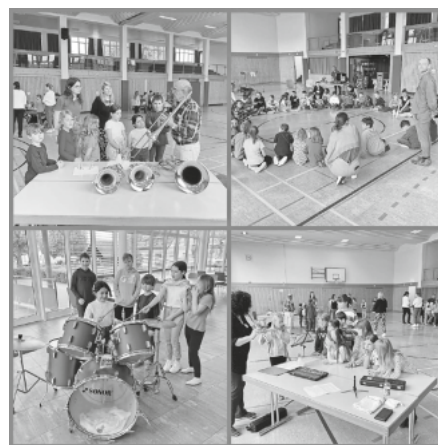
Die Kinder hatten viel Spaß beim Instrumentenkarussell

Am Montag, den 8. Mai fand das große Instrumentenkarussell an der Hermann-Brommer-Schule statt. Gemeinsam mit unseren Ausbilderinnen und Ausbildern, haben wir unsere Instrumente vorgestellt.