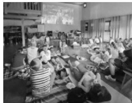
Kinoabend im Probelokal

Im Rahmen des Merdinger Ferienprogramms haben wir dieses Jahr einen Kinoabend im Probelokal veranstaltet. Unsere Jungmusikerinnen und Jungmusiker waren hierzu auch eingeladen und so konnten wir mit über 30 Kindern einen tollen Kinoabend mit viel Popcorn verbringen. Es war ein lustiger Abend, den wir gerne wiederholen möchten.