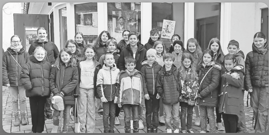
Kinonachmittag in Breisach