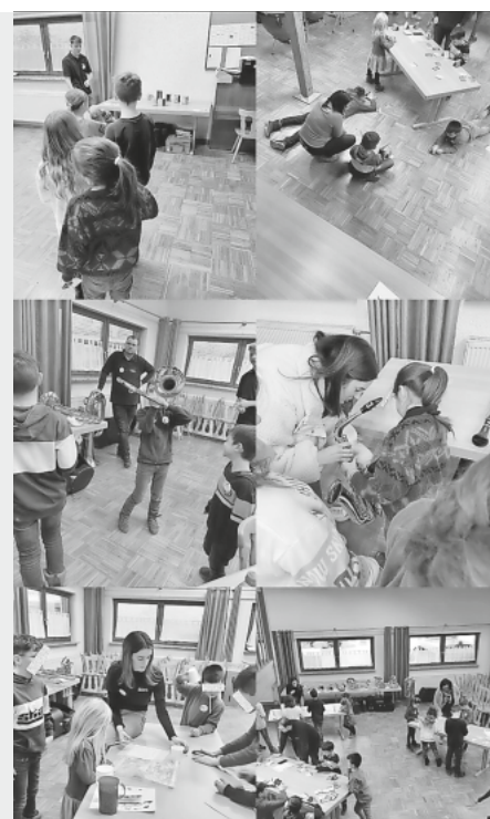
Die Spielolympiade im Probelokal