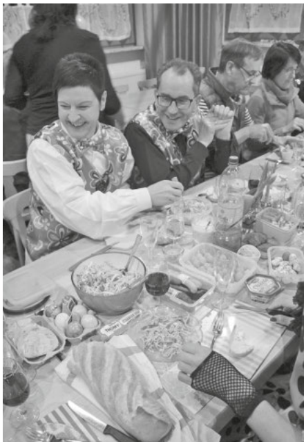
Rucksack-Vesper vom Feinsten

Mit der dritten Rucksackfasnet hat auch beim Musikverein die närrische Zeit begonnen. Mit dem Inhalt der vollbepackten Rucksäcke versorgten sich die Musikerinnen und Musiker selbst.