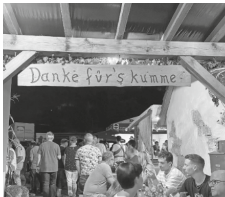
Weinfest 2023

Dienstag, 12.09.2023 19:30 Uhr Gesamtvorstandssitzung