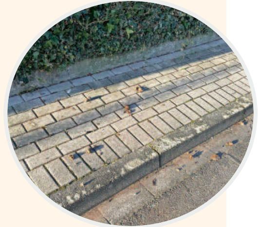
Aktuelles Beispiel: Gehweg Sellingerstraße