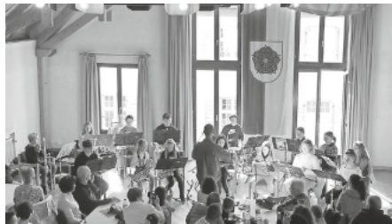
Vorspielnachmittag im Bürgersaal