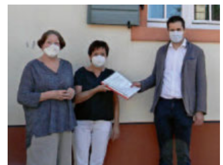
Übergabe der Unterschriftenliste

Die Vertreterinnen der Initiative zeigten sich erfreut über die aktuelle Planungsentwicklung beim „Bikezentrum Merdingen by Jan Ullrich“, dieses Seitens der Investoren ohne Spielcasino weiter planen zu wollen. Sollte diese Entwicklung in entsprechende Gemeinderatsbeschlüsse münden, wird der Verzicht auf einen Bürgerentscheid in Aussicht gestellt.