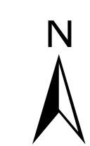
Abbildung: UTM 32N Projektion: Transverse Mercator Datum: ETRS 89 Höhendaten basierend auf Befliegungen ab 2016 Geobasisdaten © Landesamt für Geoinformation und Landentwicklung Baden-Württemberg, www.lgl-bw.de, Az.: 2851.9-1/19