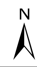
Abbildung: UTM 32N Projektion: Transverse Mercator Datum: ETRS 89 Höhendaten basierend auf Befliegungen ab 2016 Geobasisdaten © Landesamt für Geoinformation und Landentwicklung Baden-Württemberg, www.lgl-bw.de, Az.: 2851.9-1/19