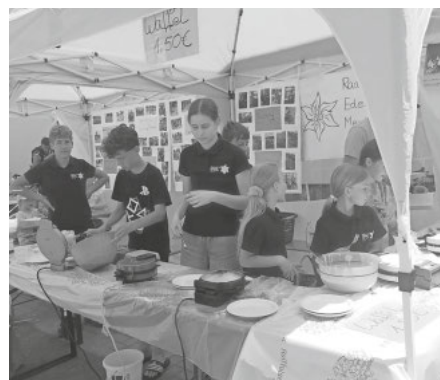
Radjugend am Waffelstand beim 65. Leo Wirth Gedächtnisrennen

Ausführlichere Infos über die Rennen erfahren Sie an dieser Stelle in der nächsten Woche.