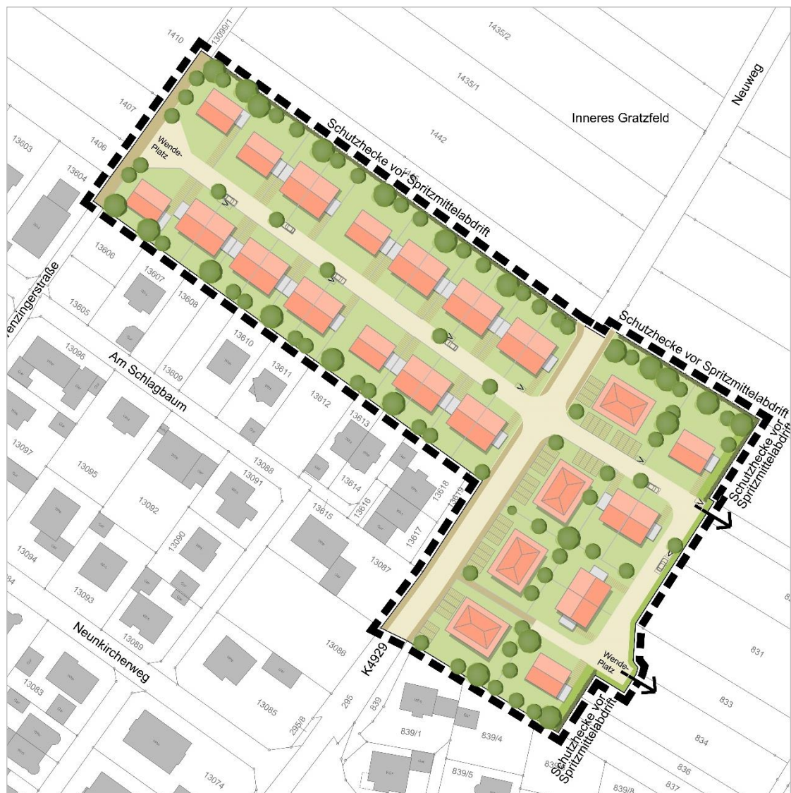
Städtebaulicher Entwurf (Stand: Februar 2022)

Darüber hinaus werden im Zusammenhang mit der geplanten verkehrlichen Erschließung bereits mögliche Erweiterungsmöglichkeiten für eine mögliche Wohngebietserweiterung in Richtung Osten vorbereitet.