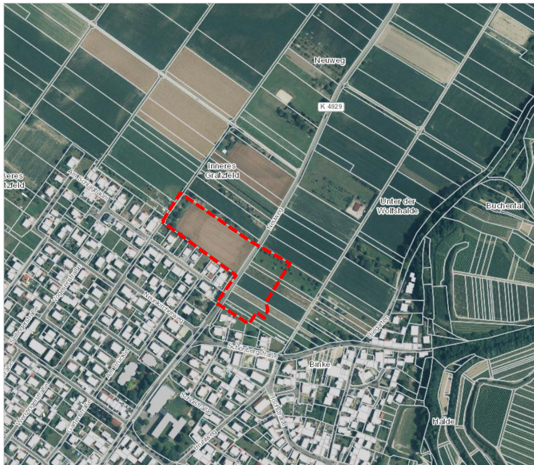
Lage des Plangebiets im Luftbild