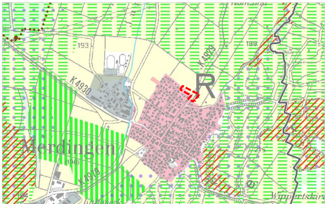
Ausschnitt Regionalplan 3.0 des Regionalverbandes Südlicher Oberrhein (rechtswirksam seit dem 22.09.2017)

Der rechtswirksame Flächennutzungsplan 2020 der vereinbarten Verwaltungsgemeinschaft Breisach-Ihringen-Merdingen (Feststellungsbeschluss am 23.03.2006) stellt für den wesentlichen Teil des Geltungsbereichs bereits geplante Wohnbauflächen „Merdingen 07“ dar. Der Bebauungsplan kann nach Abstimmung mit dem Baurechtsamt des Landratsamtes Breisgau-Hochschwarzwald aus den Darstellungen des Flächennutzungsplans entwickelt werden.